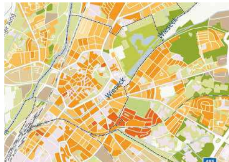
Auszug aus www.wohnlagenkarte.de | Quelle: © iib Dr. Hettenbach Institut | OpenstreetMap contributors / Lizenz: ODbL

Danach prüft das iib Institut jede Preislage nach einem umfangreichen Kriterienkatalog . Dieser berücksichtigt städtebauliche Faktoren (Gebäudezustand, Straßenbild, Verkehr (Haltestellen, Parkplätze), Versorgung (Schulen, Geschäfte), Umwelt (Lärmbelastung, Grünflächen) und Soziales (Leerstand, Straftaten). Das Ergebnis macht 70 Prozent der Gesamtwertung aus.